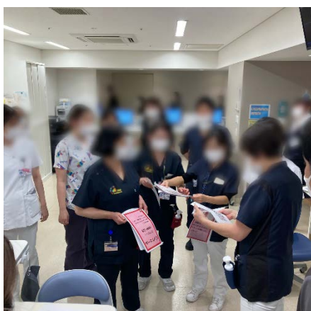
発令に伴い集まったスタッフへ指示を出す